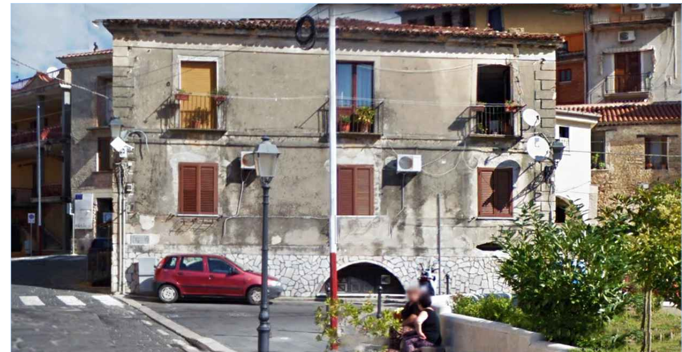
Punto di vista n. 2 ripristino intonaco - eliminare condizionatori e parabole