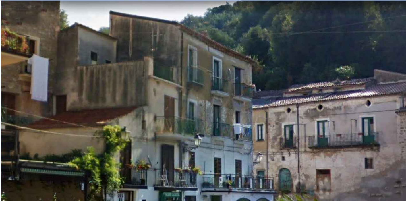
Punto di vista n. 7 ripristino intonaci e tinteggiatura