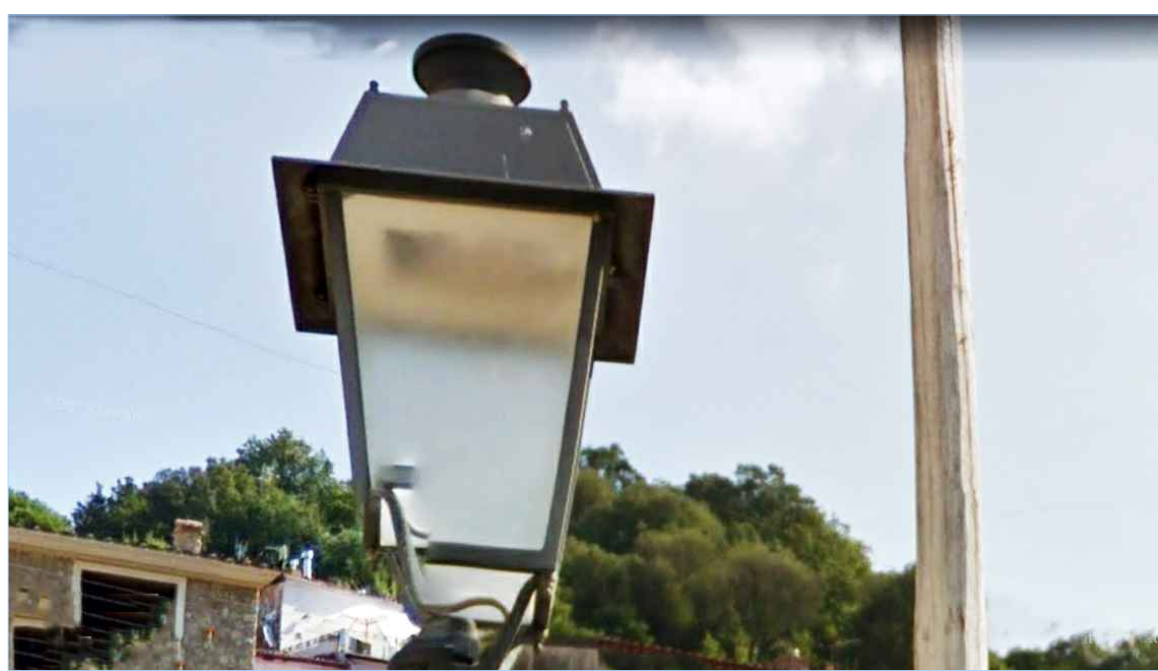
si suggerisce l'utilizzo di corpi illuminanti di buon disegno contemporaneo