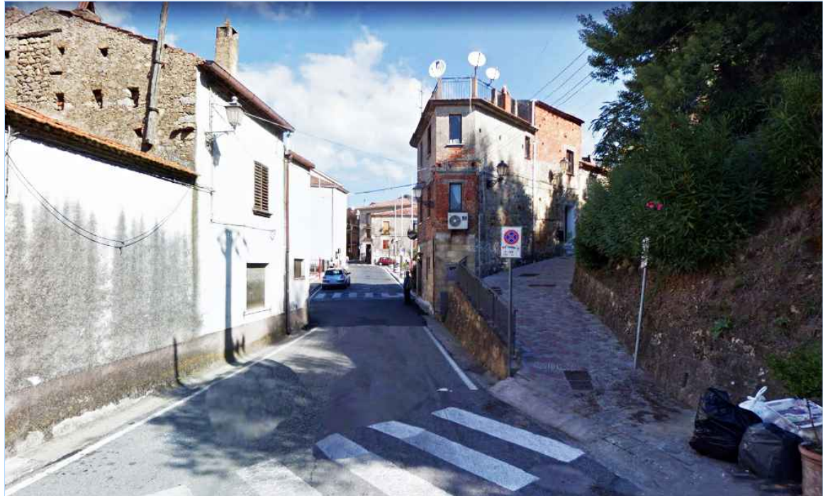
Punto di vista n. 4 ripristino tinteggiatura