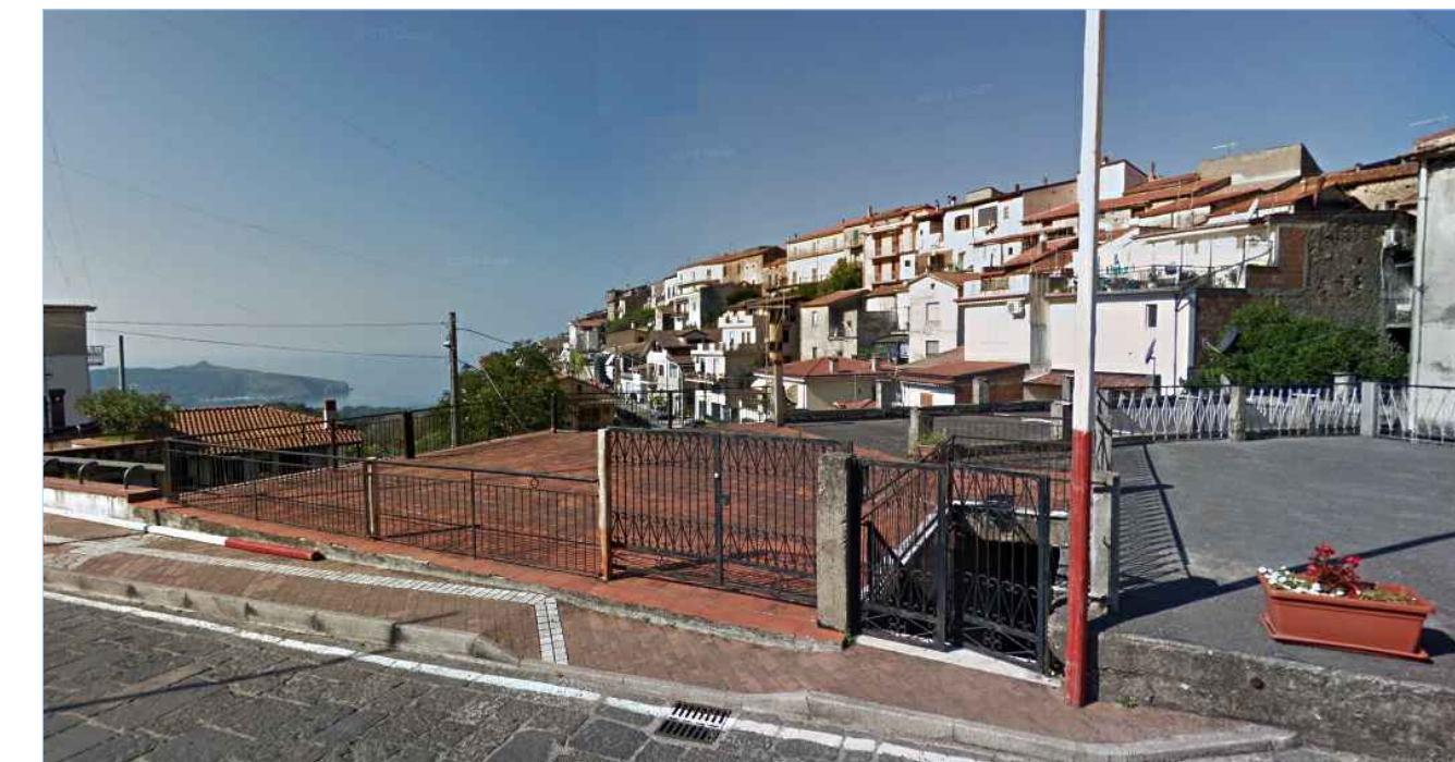
Punto di vista n. 1 recinzione da sostituire - pavimentazione belvedere