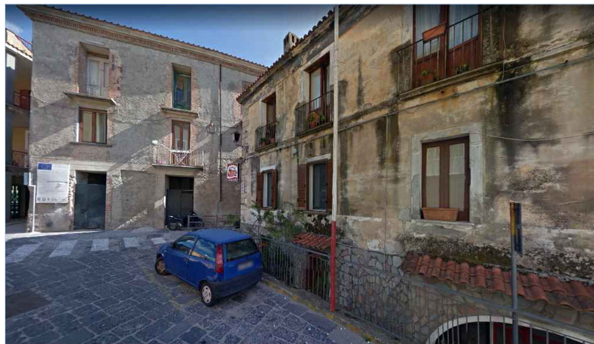
Punto di vista n. 6 ripristino intonaci e tinteggiatura