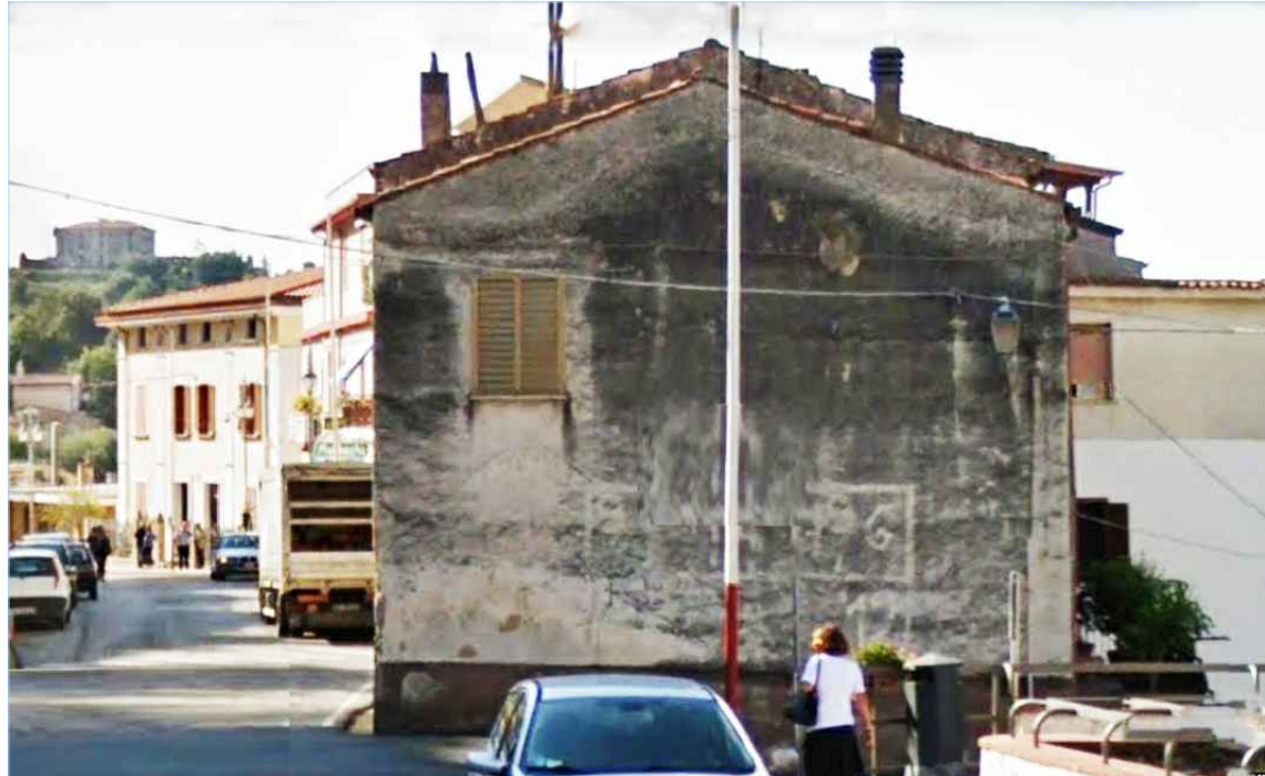
Punto di vista n. 3 ripristino intonaco