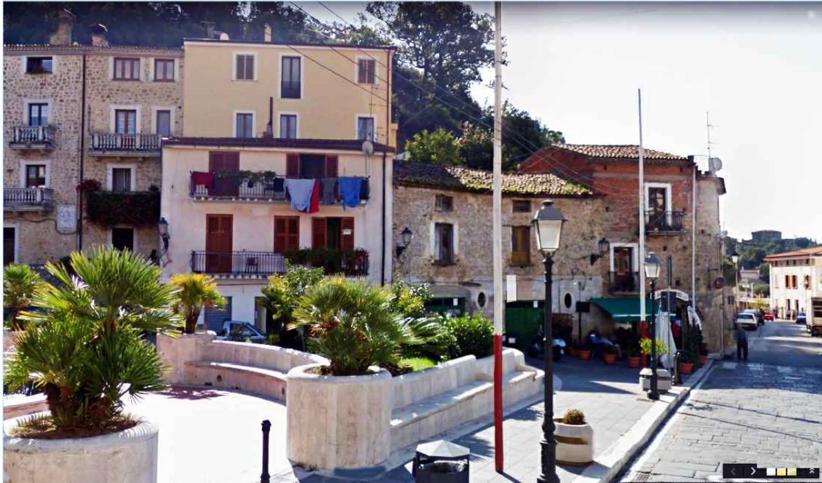
Punto di vista n. 5 maggior decoro degli edifici prospicienti spazi pubblici